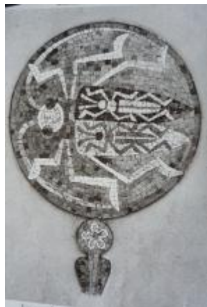
SOA Litoměřice, fond: DÍLO, podnik ČFVU, oblastní středisko Ústí nad Labem, 1962-1994, karton 19.