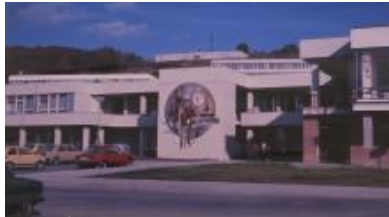
Muzeum umění Olomouc, fond: Dílo Olomouc, k. 1 (1981).

Záznam zpracován v rámci projektu „Technologie údržby a konzervace mozaiky Posledního soudu a metody restaurování-konzervování středověkého a archeologického skla“ (DF12P01OVV017) programu Národní a kulturní identity (NAKI), financovaného Ministerstvem kultury ČR. Projekt byl realizován Vysokou školou chemicko-technologickou v letech 2012–2015.