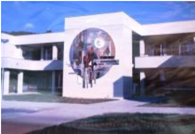
Muzeum umění Olomouc, fond: Dílo Olomouc, k. 1 (1981).