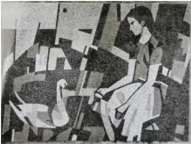
Muzeum umění Olomouc, fond Dílo, karton 5.

Záznam zpracován v rámci projektu „Technologie údržby a konzervace mozaiky Posledního soudu a metody restaurování-konzervování středověkého a archeologického skla“ (DF12P01OVV017) programu Národní a kulturní identity (NAKI), financovaného Ministerstvem kultury ČR. Projekt byl realizován Vysokou školou chemicko-technologickou v letech 2012–2015.