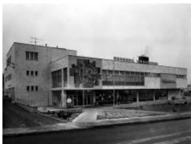
ZAO, fond: ČFVU - Dílo, Ostrava, Fotodokumentace, foto: 37