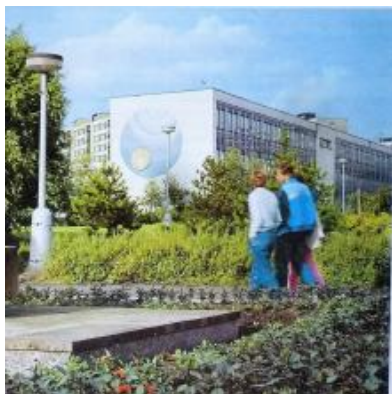
HEJDUK, Pavel. Výtvarné umění v severočeské architektuře, Výtvarná kultura XII, 1988, č. 1, s. 1-12.

Záznam zpracován v rámci projektu „Technologie údržby a konzervace mozaiky Posledního soudu a metody restaurování-konzervování středověkého a archeologického skla“ (DF12P01OVV017) programu Národní a kulturní identity (NAKI), financovaného Ministerstvem kultury ČR. Projekt byl realizován Vysokou školou chemicko-technologickou v letech 2012–2015.