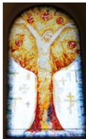
4/2014, mozaika v okně, 1988, Antonín Klouda