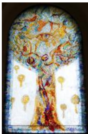
4/2014, mozaika v okně, 1988, Antonín Klouda