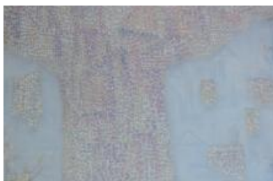
4/2014, mozaika v okně, 1988, Antonín Klouda