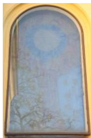
4/2014, mozaika v okně, 1988, Antonín Klouda