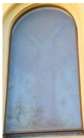
4/2014, mozaika v okně, 1988, Antonín Klouda