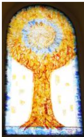
4/2014, mozaika v okně, 1988, Antonín Klouda