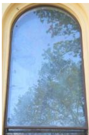
4/2014, mozaika v okně, 1988, Antonín Klouda