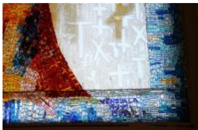
4/2014, mozaika v okně, 1988, Antonín Klouda