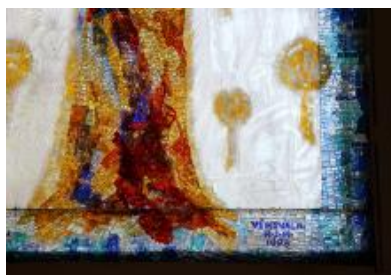
4/2014, mozaika v okně, 1988, Antonín Klouda