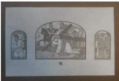
Návrh díla, MZA Brno, fond: Jezuité Hostýn, kt. 6.

Záznam zpracován v rámci projektu „ Restaurování mozaik tzv. české mozaikářské školy ze skla a kamene “ (DG16P02M056) programu Národní a kulturní identity (NAKI), financovaného Ministerstvem kultury ČR a realizovaného Fakultou restaurování Univerzity Pardubice a Ústavem chemické technologie restaurování Vysoké školy chemicko-technologické.