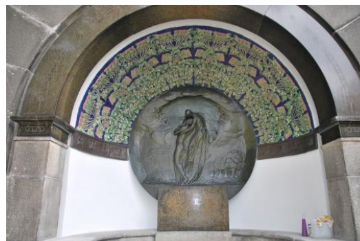
10/2017, stav po restaurování

KUČEROVÁ, Irena, KŘENKOVÁ, Zuzana a ŘÍHOVÁ, Vladislava (eds.). Ornament s motivem bodláků na náhrobku rodiny Pfeiffer-Kral. České mozaiky [online]. Vysoká škola chemicko-technologická v Praze a Univerzita Pardubice, © 2024. [cit. 18.10.2024]. Dostupné z: ceskemozaiky.cz/zaznam/222