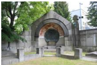
6/2015, v průběhu restaurování