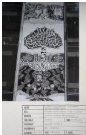
KGUVU ve Zlíně, fond: Kartotéka Díla Gottwaldov