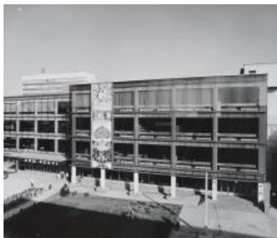
KGUVU ve Zlíně, album Výtvarné dílo v architektuře