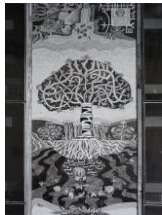
KGUVU ve Zlíně, fond: Kartotéka Díla Gottwaldov