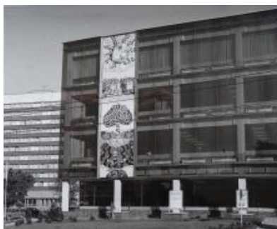
KGUVU ve Zlíně, fond: Kartotéka Díla Gottwaldov